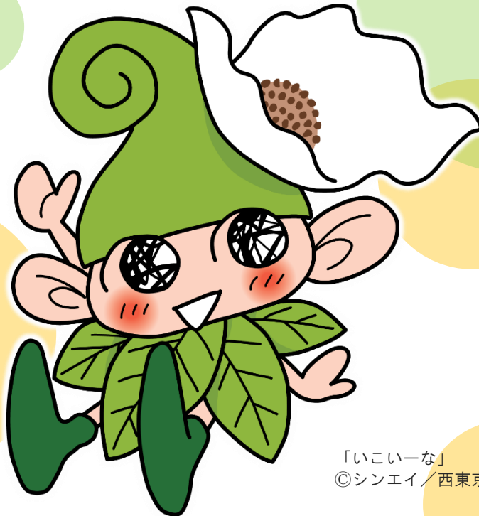
「いこいーな」 ©シンエイ／西東京市

次のページから、 子ども条例に書かれている 内容をさらに詳しく 紹介していくよ！