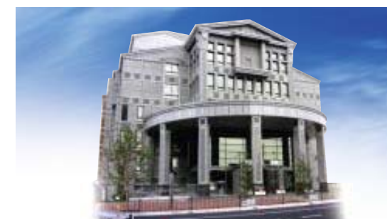
枚方市立中央図書館

自然や広場だけでなく、まなびの好奇心や意欲をサポートする図書館、人とのふれあいや交流を支える施設も設け、多彩な表情のある公園として親しまれています。