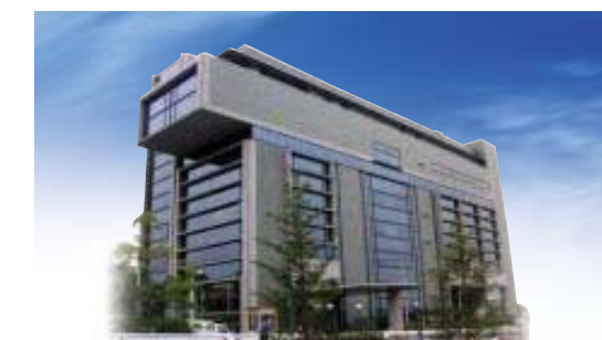
輝きプラザきらら

地下1階、地上7階、延床面積9,301㎡。専門書を含め多様な図書や音楽CD、ビデオなどを所蔵し、貸出します。また点字図書や録音図書の製作・貸出、字幕付ビデオの編集もでき、市民の皆様の知的好奇心を育みます。