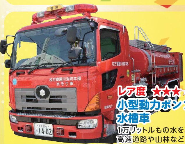
レア度 ★★★★★ 小型動力ポンプ付水槽車 1万リットルの水を積載。高速道路や山林など、水がない場所で活躍！