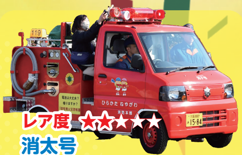
レア度 ★★★★★ 消太号 子ども用広報車。後部座席では手動でサイレンを鳴らせます！