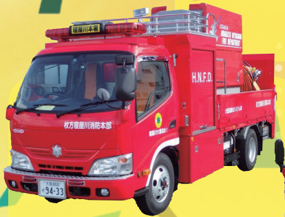
レア度 ★★★★★ 大量送水車 1分間に4,500ℓ(お風呂23杯)の水を送水・排水！