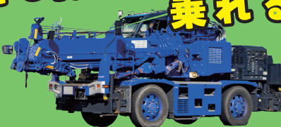
ラフテレーンクレーン 大きなクレーンで重たいものを持ち上げます！