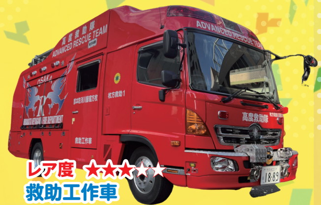
レア度 ★★★★★ 救助工作車 人の命を救うスペシャリスト、救助隊員が乗ります！