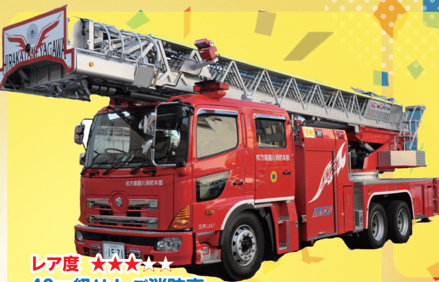
レア度 ★★★★★ 40m級はしご消防車 ビル13階分の高さまではしごを伸ばせます！