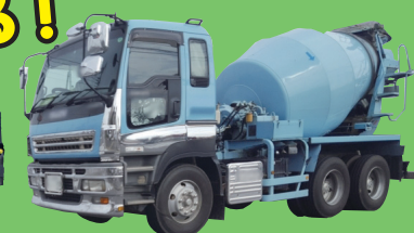
ミキサー車 災害時は消火水を搬送します！