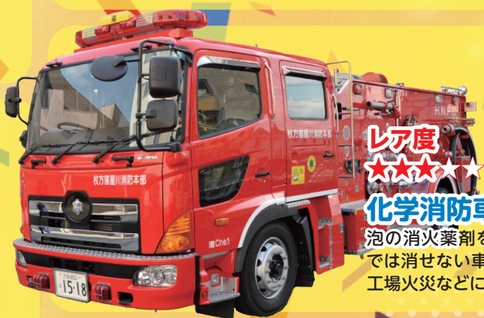
レア度 ★★★★★ 化学消防車 泡の消火薬剤を搭載。水では消せない車両火災や工場火災などに！