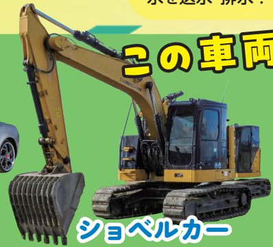
ショベルカー 土砂災害などの大災害に大活躍！