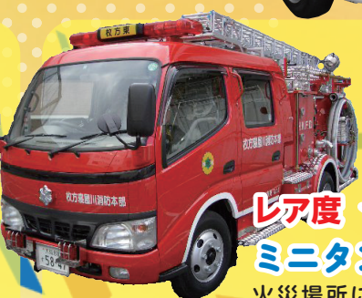
レア度 ★★★★★ ミニタンク車 火災場所に1番近いで消火活動します！