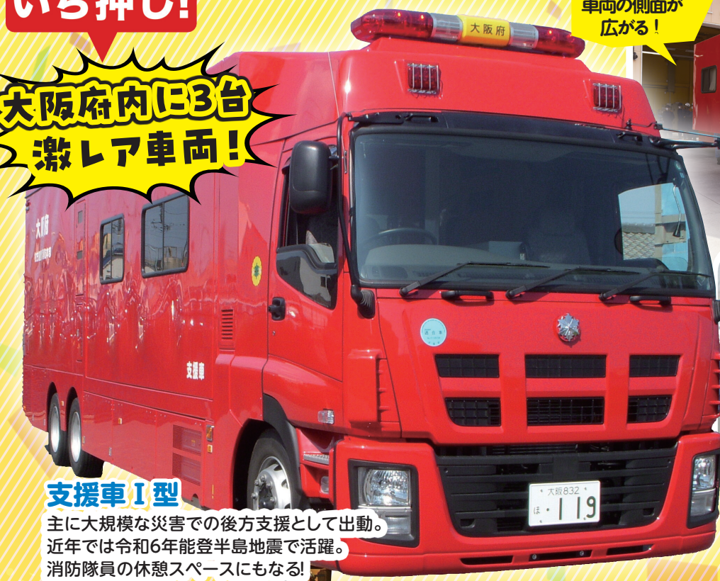
支援車Ⅰ型 主に大規模な災害での後方支援として出動。近年では令和6年能登半島地震で活躍。消防隊員の休憩スペースにもなる！