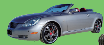
オープンカー パレードの先頭を行く気分を味わおう！